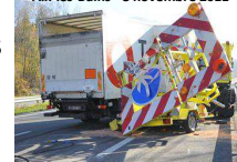
VRU Chambéry - 11 avril 2016