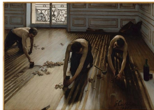
Gustave Caillebotte, Les raboteurs de parquet, 1875, Musée d'Orsay