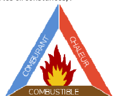
Le triangle du feu