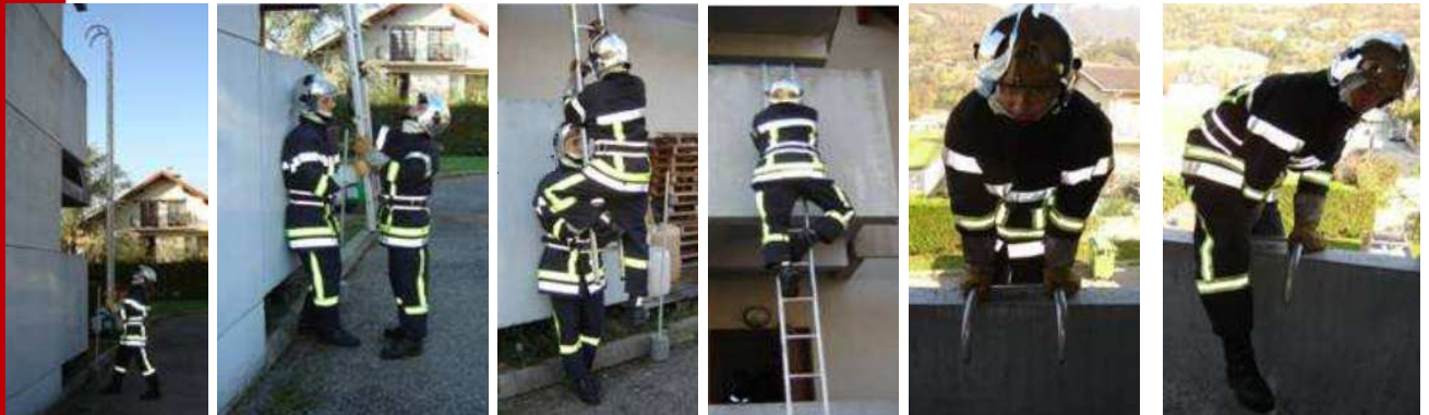
Quelques étapes de mise en œuvre et utilisation d'une échelle à crochets. Tous les détails sont disponibles sur Intranet dans le guide "Manœuvres de sauvetage - Echelles à crochets" de l'EDSP73