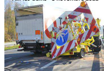
VRU Chambéry - 11 avril 2016